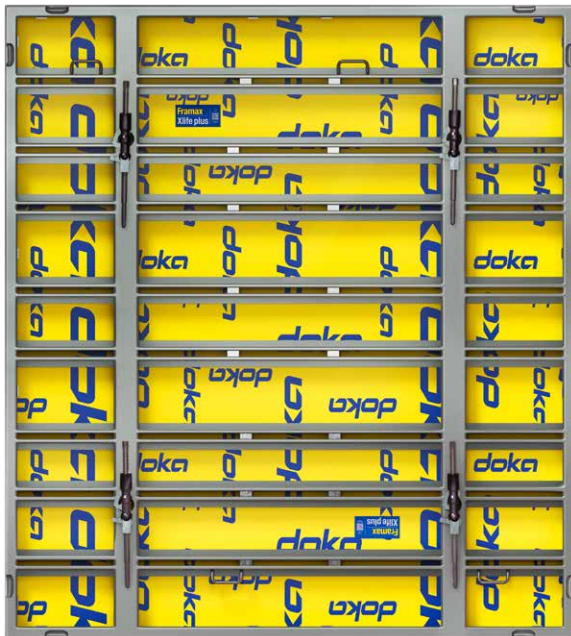
Framax Xlife plus 2,70 x 3,00 m: nur 4 Anker auf 8,1 m 2 Schafffläche