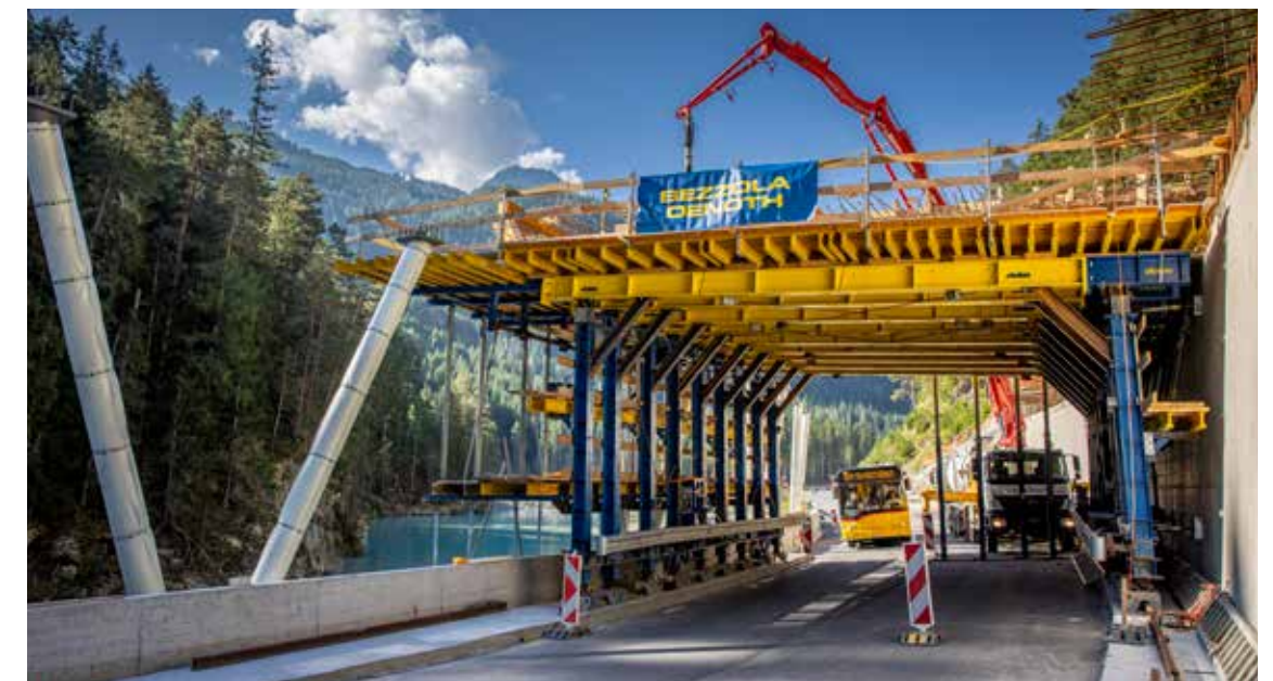
Galerie Mingér | Schweiz | Doka UniKit Jochträger und Verlängerungen

Die modularen Träger können bereits im Werk auf Wunschlänge vormontiert werden und kommen so direkt einsatzfähig auf Ihre Baustelle. Bauseitige Leistungen wie z.B. Kranarbeiten werden so reduziert und gleichzeitig werden wertvolle Zeit und Platz gespart.