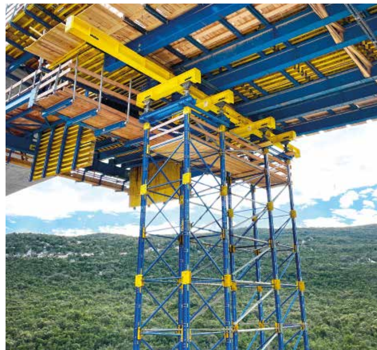
Dumanja Jaruga | Kroatien | Doka UniKit Lastturm 480kN, Joch- und Längsträger, Verlängerungen und Schwerlastjoche