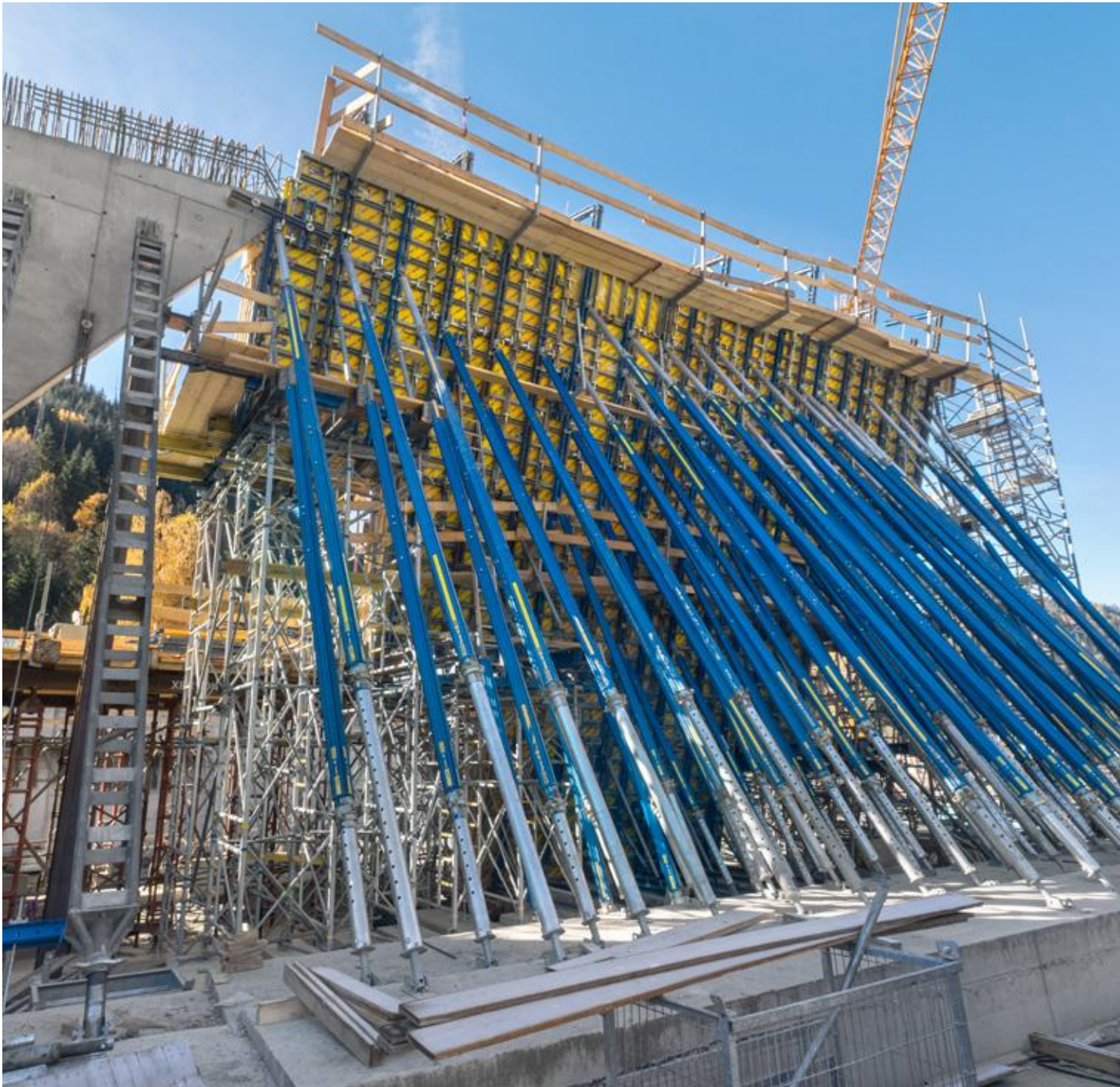
▲ Um ein derart komplexes Bauwerk mit unzähligen Knicken in Wand und Decke optimal und sicher herzustellen, ist die Schalungsplanung in 3D unumgänglich.

in der Zwischenzeit die Sanierung der Weströhre inklusive der zweiten Hälfte von Nord- und Südportal zu erbauen. Für den Bau der Portalgalerien erstellt die Baustellenmannschaft sowohl bei den Portalgalerien der Ost- als auch der Weströhre im ersten Schritt die Trennwände zwischen den beiden „Flügeln“. Als Wandschalung dient die stufenförmig angeordnete Framax Xlife, die mit trapezförmigen Ausgleichshölzern verbunden wird, um die Knicke zu schalen. Da bei der komplexen Bauwerksgeometrie jeder Abschnitt anders gestaltet ist, berücksichtigt Doka bereits bei der Planung, dass möglichst große