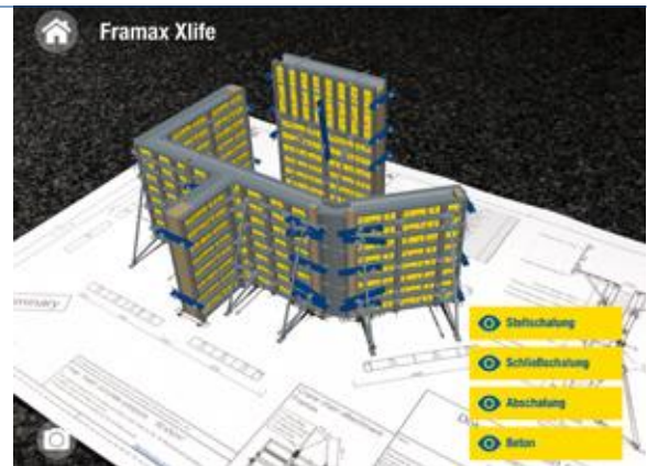
▲ Aus 2 mach 3: Dank AR-App wird aus dem zweidimensionalen Montageplan ein dreidimensionaler, der das Verständnis für den Aufbau immens erleichtert.

Während die Schalungsplanung schon lange auch in 3D erfolgt, wird auf Baustellen noch viel mit 2D-Plänen oder -Montageanleitungen gearbeitet. Ein zweidimensionales Konstrukt mit einem dreidimensionalen Plan aufzubauen, ist verständlicherweise nicht die einfachste und fehlerresistenteste Methode. Eine Möglichkeit, 2D-Pläne quasi 3D-fähig zu machen, ist Augmented Reality (AR). Zudem können per AR Sicherheitshinweise und andere hilfreiche Informationen eingeblendet werden (vgl. Doka-AR-App). Per AR können Bauleiter und Polier außerdem direkt abgleichen, ob der tatsächliche Aufbau der virtuellen Darstellung auf ihrem Smartphone oder Tablet entspricht und damit die Abnahme schneller und noch sicherer abwickeln.