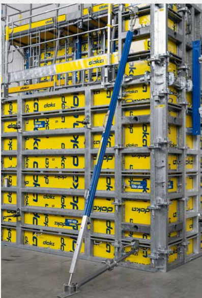
Elementstütze an der Schalung (mit Elementstützenschuh)

Die DokaRex Einrichtstützen können mit Hilfe eines einfachen Adaptersets auch an allen Framax, Frami und Top 50 Wandschalungen eingesetzt werden: