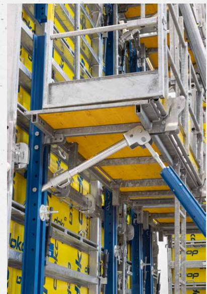
Anschluss an der Xsafe plus-Bühne (mit Adapter Bolzenset)