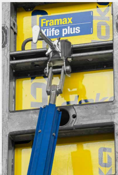
Anschluss der Schalung (mit Adapter Bolzenset)