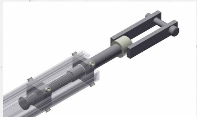
Das verdeckte Gewinde schützt vor Verschmutzung und sorgt für hohe Langlebigkeit und geringen Wartungsaufwand.