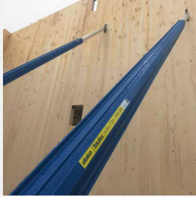
An Holz- und Stahlkonstruktionen