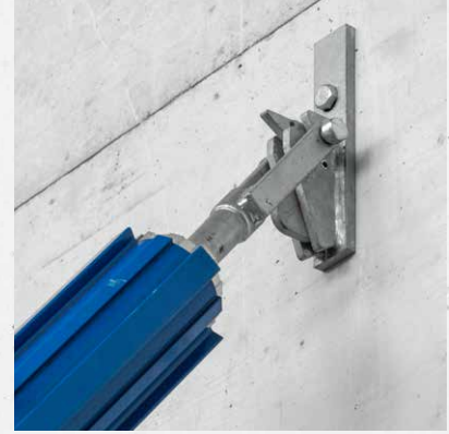
Anschluss vom Boden aus mittels Schnellanschlusskopf