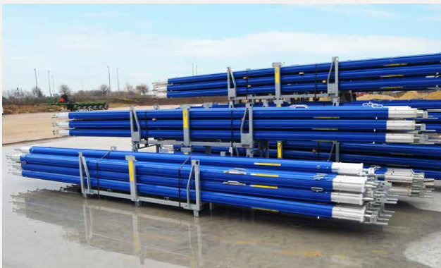
Die DokaRex wird komplett einsatzfertig auf Ihre Baustelle geliefert.